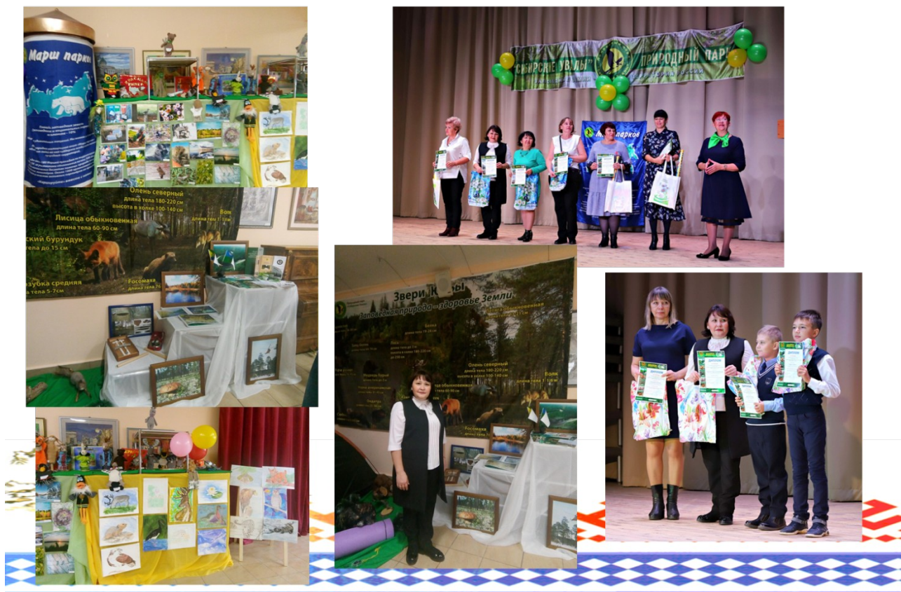
Фото участие в городских мероприятиях