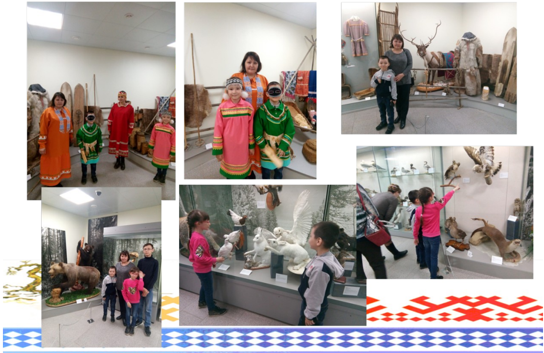
Фото «Сетевое взаимодействие»