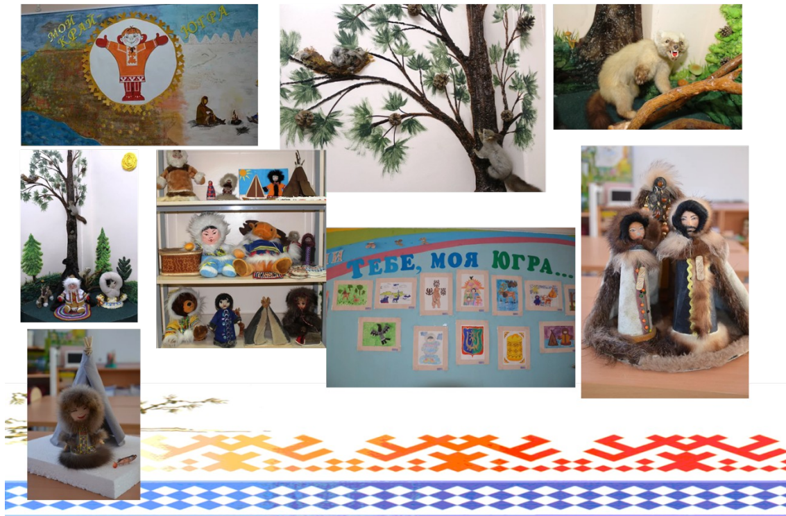
Фото «Сетевое взаимодействие»